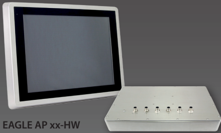
EAGLE AP xx-HW