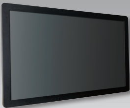
EAGLE xx-CX; EAGLE xx-CXi